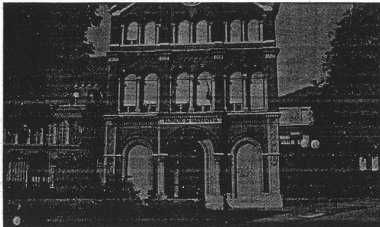
L'ex istituto San Giuseppe di piazza Sant'Eusebio sede dell'ateneo vercellese

Nello specifico il Master in Comunicazione aziendale su Internet si propone di formare un addetto alla comunicazione aziendale che sia in grado di valutare le possibilità offerte dalla comunicazione on-line, di ideare specifici servizi su