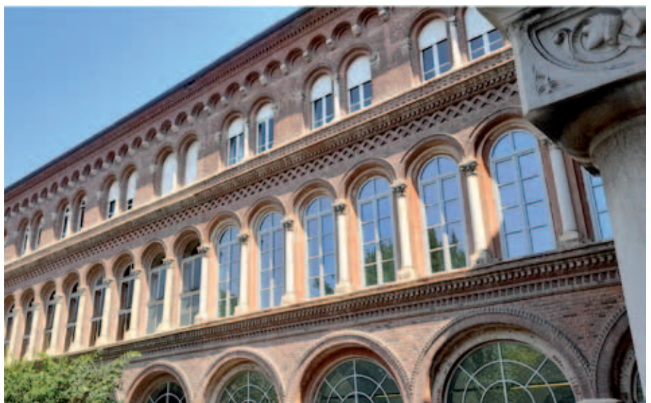
Il Complesso ex S. Giuseppe, sede degli uffici Univer.

Il programma “New energy, green e clean tech” si pone l’obiettivo di facilitare ed accelerare l’ingresso sul mercato di idee imprenditoriali innovative, dedicato a startup e piccole imprese esordienti nel campo di innovazione e transizione energetica, green technologies e